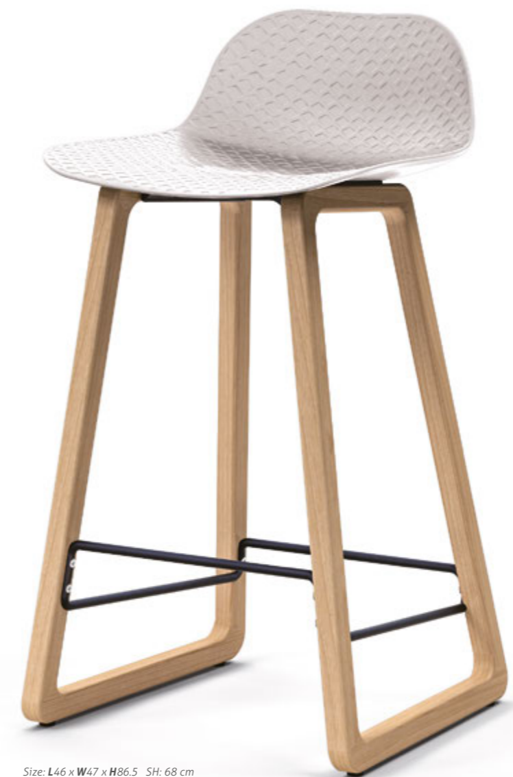
Size: L46 x W47 x H86.5 SH: 68 cm